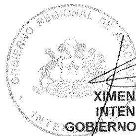
XIMENA MATAS QUILODRAN INTENDENTA REGIONAL GOBIERNO REGIONAL DE ATACAMA