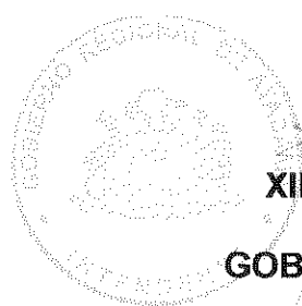
XIMENA MATAS QUILODRAN INTENDENTA GOBIERNO REGIONAL ATACAMA

Por la Institución: CENTRO GENERAL DE PADRES Y APODERADOS DE LA ESCUELA BASICA GASPAR CABRALES