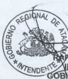
RAFAEL PROHENS ESPINOSA INTENDENTE REGIONAL GOBIERNO REGIONAL ATACAMA