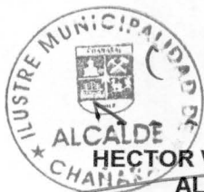
ALCALDE HECTOR VOLTA ROJAS ALCALDE I. MUNICIPALIDAD DE CHAÑARAL

DÉCIMO TERCERO: El presente instrumento se extiende en cuatro ejemplares todos de igual valor y tenor, quedando dos ejemplares en poder de cada una de las partes.