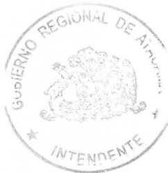
RAFAEL PROHENS ESPINOSA INTENDENTE GOBIERNO REGIONAL ATACAMA

Por la Institución: UNION COMUNAL DE JUNTAS DE VECINOS NORTE